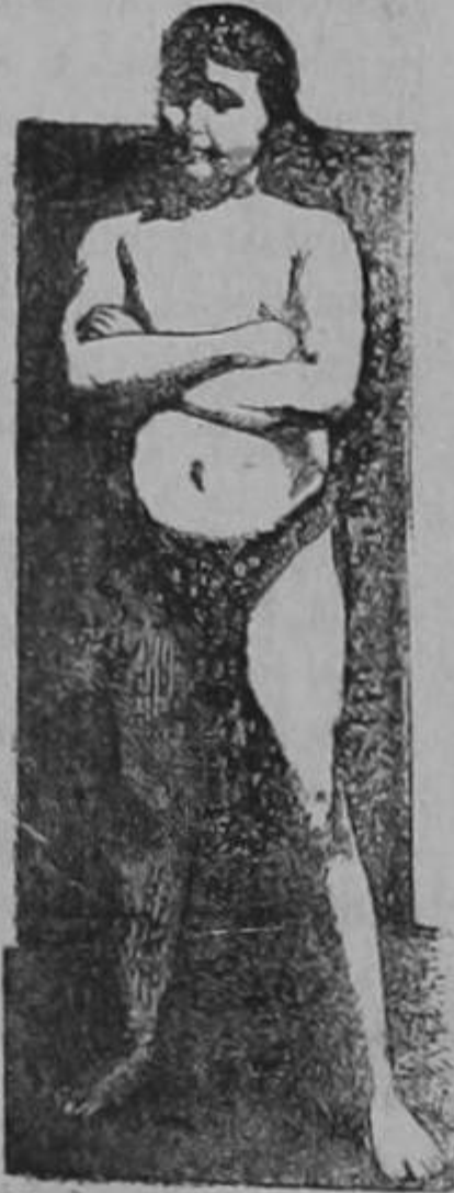
EDAD 11 AÑOS

La transformación maravillosa de un sér endeble y raquítico en un adolescente fuerte, robusto y sano, como lo demuestra su atlética figura, fué obra realizada por la